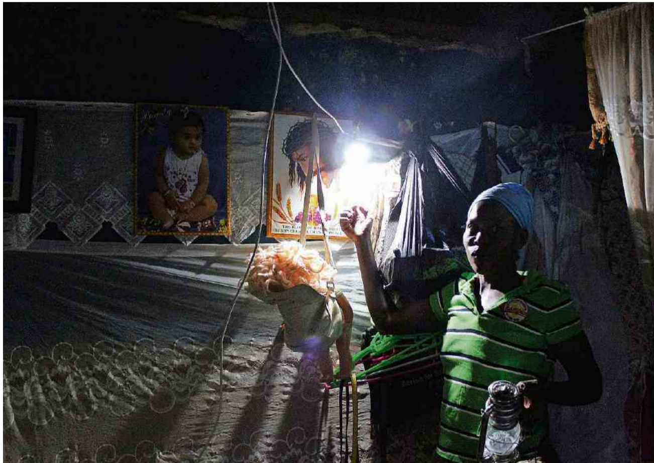
So wie Afrika beim Telefon den Schritt übers Festnetz ausgelassen hat und gleich beim Handy landete, wird man vielerorts beim Strom die Stufe «Netz» überspringen und sofort zu dezentralen Lösungen greifen. Eine Lösung kommt aus Zwingen.

Also bleibt nur Leasing. Damit die Raten wirklich reinkommen, kann der lokale Händler durch eine Handy-App für einige Tage - deren Zahl ist abhängig von der Höhe der Ratenzahlung - das System freischalten. Wer nach Ablauf dieser Frist nicht bezahlt, hat also die Geräte im Haus, kann sie aber nicht mehr nutzen. In Ostafrika funktionierte in einem Feldversuch der Verkauf der Oolux-Geräte zwischen den Retailern und den Endkunden. «Da man in Kenia