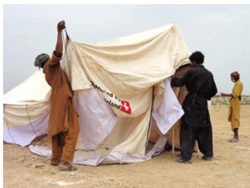
Montage de tentes à Hyderabad (province du Sindh) - une tente de la DDC permet d'accueillir 6 à 10 personnes