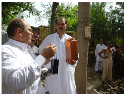
Appareil pour la production de chlore pour la désinfection de l'eau et nettoyage d'un puits à Mardan (province de KPK)