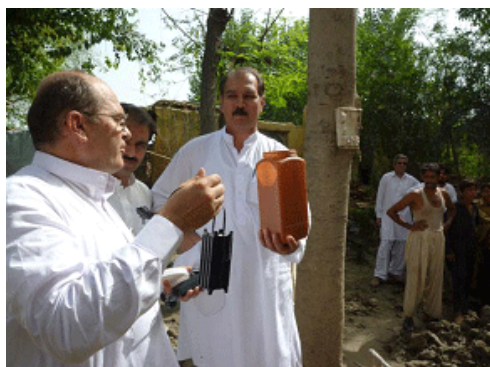
Appareil pour la production de chlore pour la désinfection de l'eau et nettoyage d'un puits à Mardan (province de KPK)