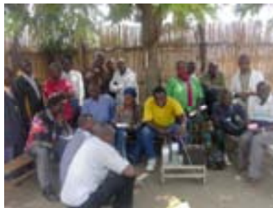
Des villageois se font expliquer le maniement du HDC.

Le projet de développement communautaire du PNUD (Com Dev) a acheté et