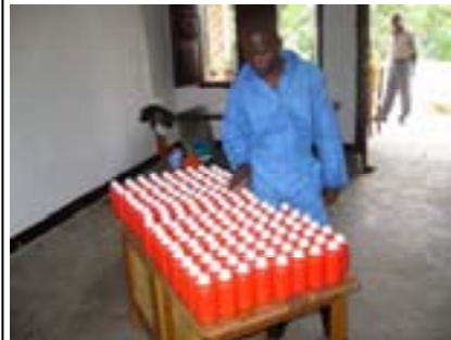
Chacun de ces flacons permet de rendre potables 1.500 litres d'eau !

L'eau se transforme en liquidités... Quoi de plus logique après tout ?